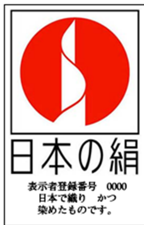
和装用シール及びタグの様式